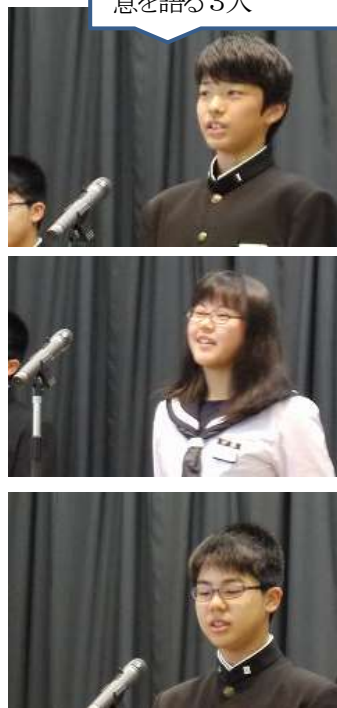
始業式で2学期の決 意を語る3人