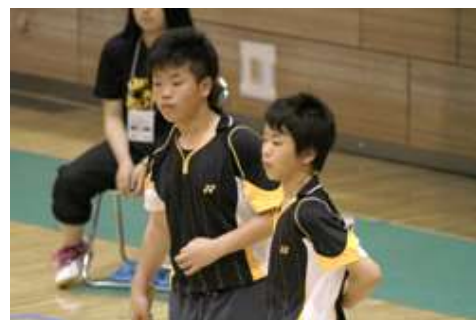
3年生はこの大会で引退という形で〇〇〇〇さん、〇〇〇〇さんが

引退となりますが、二人の3年生の分までも次回の大会ではよい成績を上げ、来年もぜひ全道大会に出場してほしいと思います。